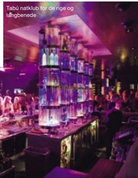
Tabú natklub for de rige og længbenede

PRISLISTE Café latte 25 kr. Internet/døgn 60 kr. Drink 70 kr. Cafémåltid 60 kr. Taxa fra lufthavnen 100 kr. Offentlig bytransport 30 kr.