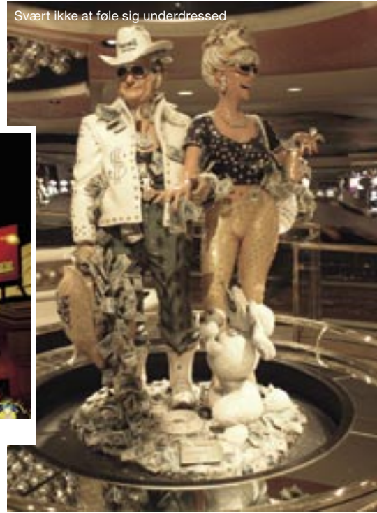
Svært ikke at føle sig underdressed