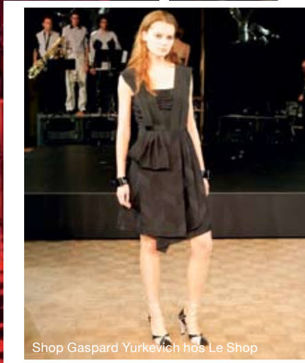
Shop Gaspard Yurkevich hos Le Shop