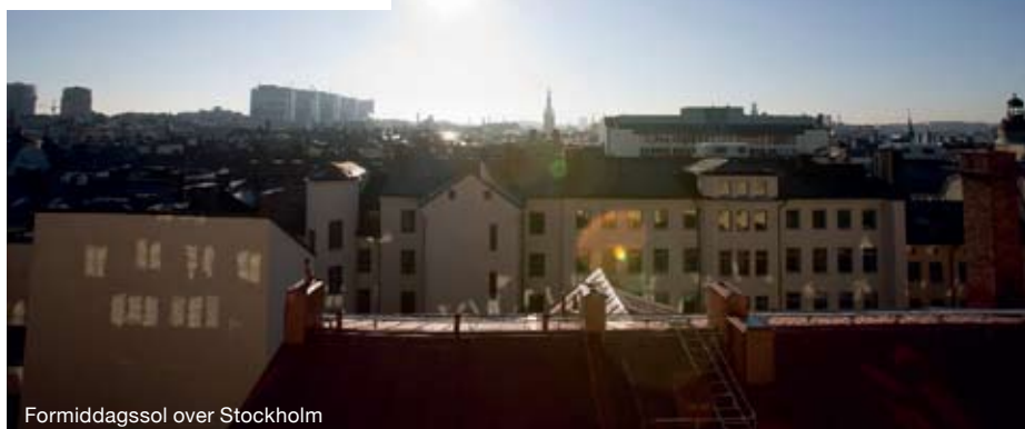
Formiddagssol over Stockholm

få lidt hår i maden. Danserestaurantbarer er yderst populære i Stockholm, og nyeste skud på stammen er den gyldne, urbane rokokodrøm Grill (Drottninggatan 89) og Funky East (Stureplan 13), der kombinerer modetografi, videoinstallationer og dj med en god gang sushi. På den lille Svart Kaffe (Söder Mannagatan) spiser avantgarden deres frokost et stenkast fra Söderkvarterets hektiske shopping. Dessertbaren Xoxo (Rörstrandsgatan) er det rigtige sted at besøge, hvis det er himmelske desserter og chokoladekreationer, der drømmes om. Skråt overfor ligger Stockholms bedste kaffebar, Mellquist Caffé , hvor de lokale spiser havregrød og ostemadder til deres gourmet cafe latté. Er det tid til en romantisk middag og en god flaske vin, er den intime og hyggelige Teatergrillen (Nybrogatan 3, teatergrillen.se) det perfekte sted.